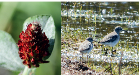
Blodkløver og Tinkesmede, Haraldsminde