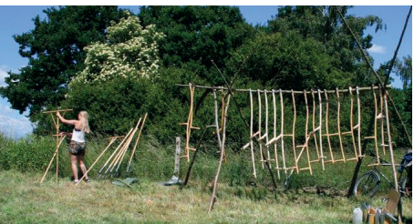
Høslet, kom og prøv, vi har det rigtig sjovt

Danmarks Naturfredningsforening, Ballerup afdeling. ballerup@dn.dk