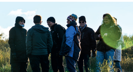
Årsmøde og naturvandring Kildedal