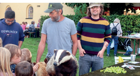
Børnene hilser på grævling ved Høstmarkedet